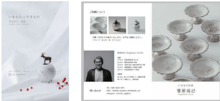
パンフレット / ブックレット / 展示会 DM などの作成