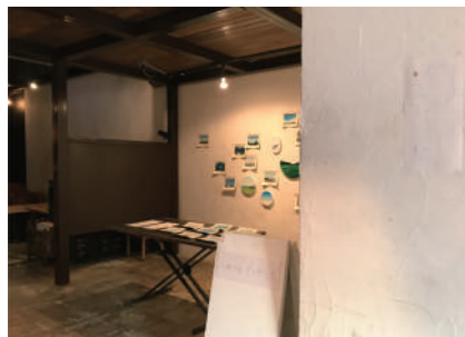
持て余しているスペースを利用して展示会やイベントを開催。 古民家・ライブハウス・商店・空き家など

風景をモチーフにした絵画により、空間を彩りたい、 相談したいなど、まずはお声かけください。