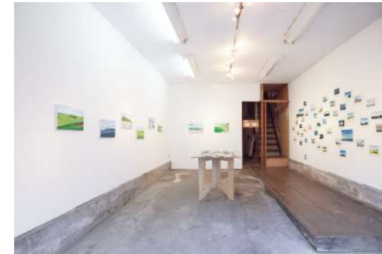
展示会の企画から運営までおこなえます。