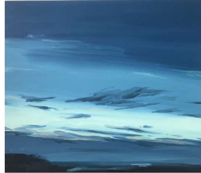
空がほどける キャンバスにアクリル絵具 2022