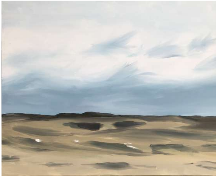
この砂にかえる キャンバスにアクリル絵具 2022